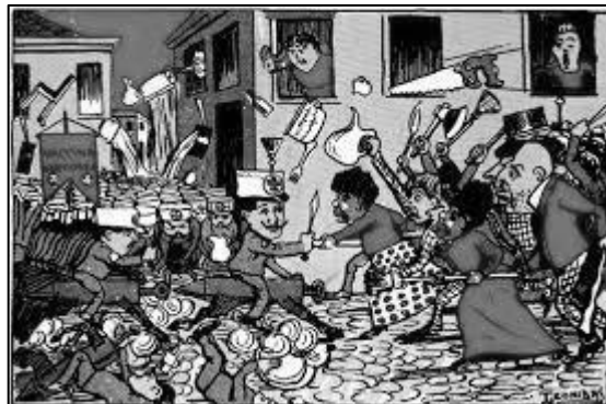
Figura 3 por Leônidas Freire (1882 – 1943) – o malho, nº 111, 29/10/1904, domínio público, HTTPS://COMMONS.WIKIMEDIA.ORG/W/INDEX.PHP?CURID=43954452

A República Brasileira passou por variados movimentos de contestação tanto no campo quanto na cidade. A imagem acima faz referência a uma dessas revoltas ocorridas em novembro de 1904, no Rio de Janeiro, então capital federal, sendo um reflexo de toda uma insatisfação popular fruto do processo de urbanização do Rio de Janeiro, retirando as pessoas dos cortiços do centro da cidade, sendo remanejadas para áreas periféricas. Estamos nos referindo a: