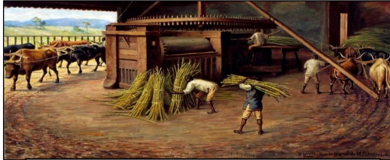
Figura 1 https://www.todamateria.com.br/engenho-de-acucar-no-brasil-colonial/

25. A imagem acima está relacionada ao processo de exploração colonial durante o Período colonial brasileiro, baseado na prática da produção latifundiária, com base no trabalho escravo e voltado para o mercado externo. A imagem se refere a que tipo de engenho: